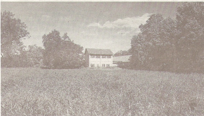
Il complesso agricolo delle Cascine Orsine