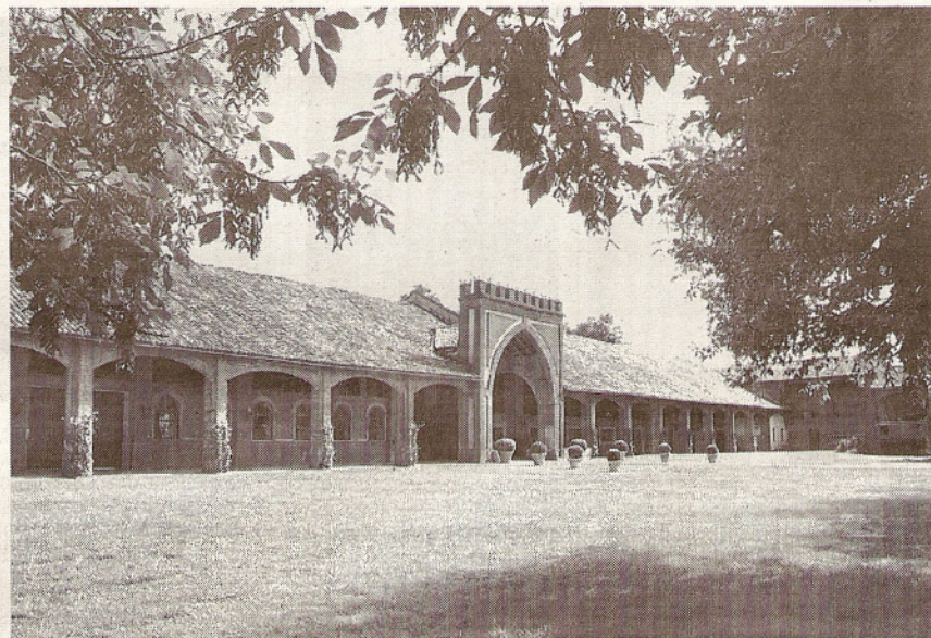
Il porticato della Tenuta San Giovanni a Olevano

lenzio le acque, gli alberi e le distese di pianura produttiva che le circondano — scrive Giuseppe Visconti — La natura accoglie quasi assimilandoli i fabbricati mattoni rossi, i canali, le chiuse, le pievi». La provincia di Pavia